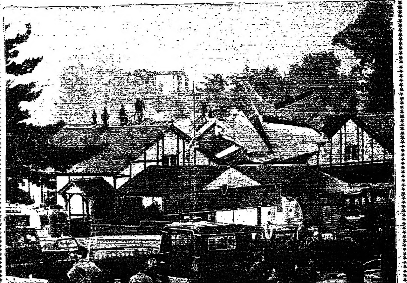
كتما هو جزء أساسي من البناء، لا جزء من كارثة جوية... قبل طائرة استطلاع بحرية فرنسية على ظهر نادي المؤسسة الاجتماعية لتسوية الطران الملكية البريطانية في فانجور بمقاطعة هامبشاير البريطانية. لقد تحطمت الطائرة خلال العرض السنوي للطيران واشتملت فيها التيران وإمكانات تشغيل ١٢ جثة من طيها